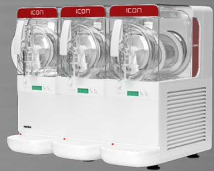
MODELL GRANITOR® ICON 3-3