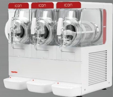
MODELL GRANITOR® ICON 6-3 EASY