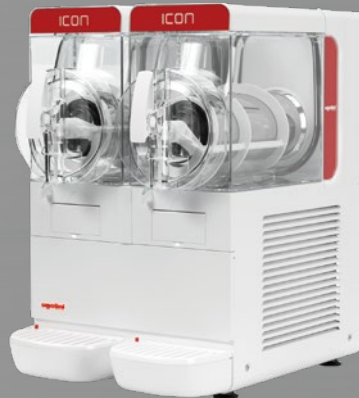
MODELL GRANITOR® ICON 6-2 EASY