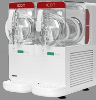
MODELL GRANITOR® ICON 3-2