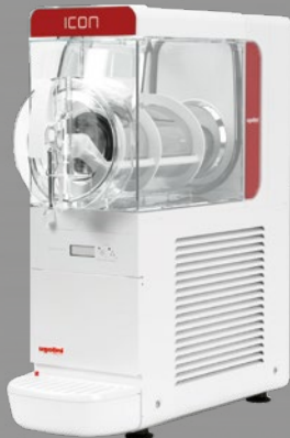
MODELL GRANITOR® ICON 6-1 ETC