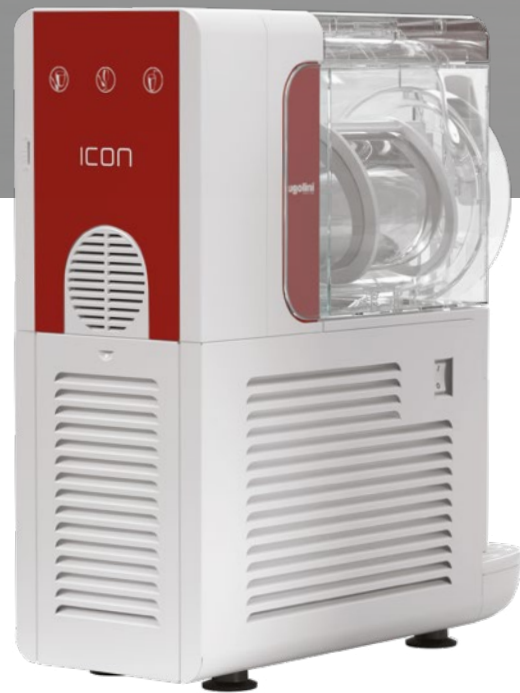
MODELL GRANITOR® ICON 3-1