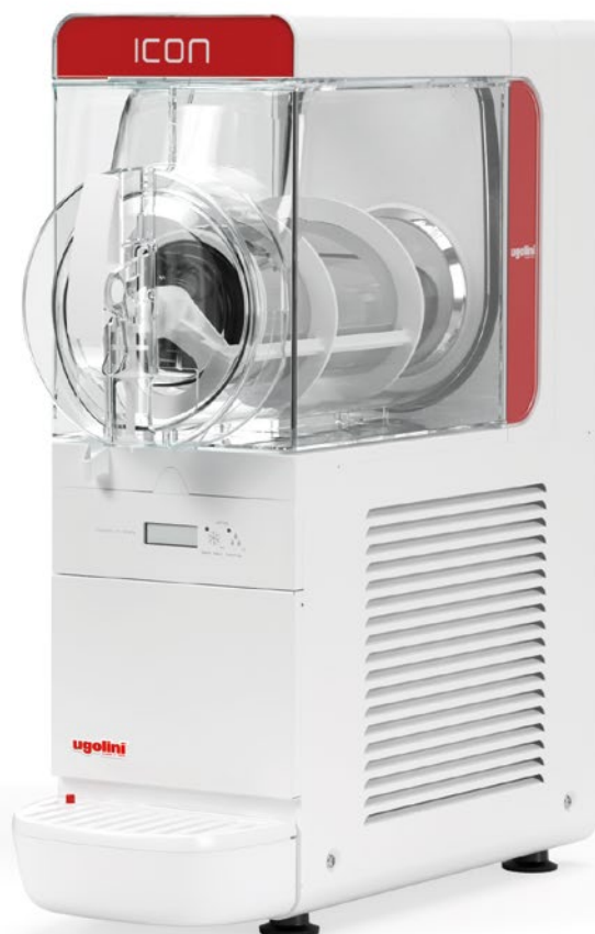
MODELL GRANITOR® ICON 6-1