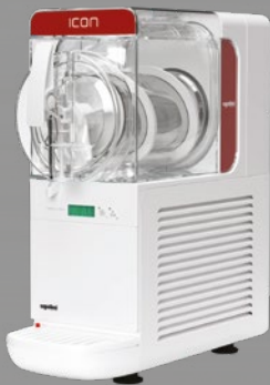
MODELL GRANITOR® ICON 3-1