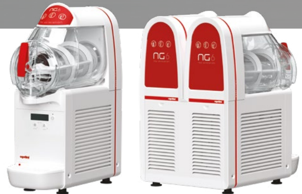
MODELL GRANITOR® NG ELECTRONIC 6/1 & 6/2